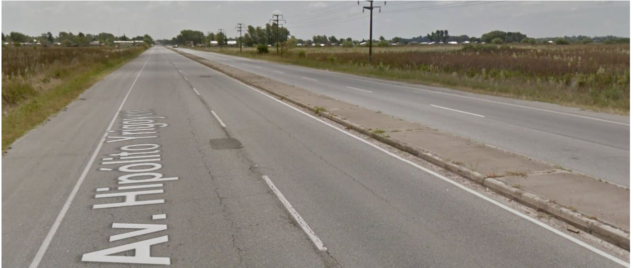
Imagen 3. Deterioro en pavimento flexible en R.P. N° 210, Partidos San Vicente y Pte. Perón.