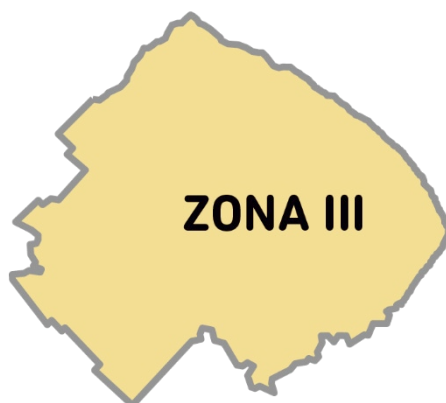
Imagen 2. La Zona III está conformada por los Partidos: ALTE. BROWN, AVELLANEDA, BERAZATEGUI, BERISSO, BRANDSEN, CAÑUELAS, CHASCOMÚS, ENSENADA, ESTEBAN ECHEVERRÍA, EZEIZA, FLORENCIO VARELA, GRAL. BELGRANO, GRAL. PAZ, LA PLATA, LANÚS, LEZAMA, LOMAS DE ZAMORA, MAGDALENA, MONTE, PTE. PERÓN, PUNTA INDIO, QUILMES y SAN VICENTE.