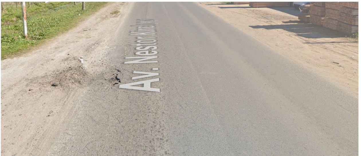
Imagen 4. Deterioro de pavimento flexible en Cno. Sec. 129-01, Partido de Pte. Perón.